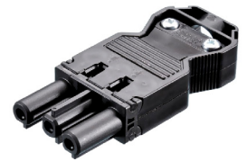
Unidad de conexión para cable Unité de connexion pour câble Conexion unit for wire