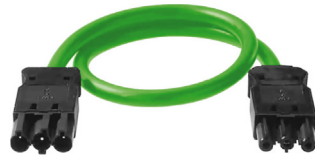
Prolongación Cable 2 m Prolongation Câble 2 m Extension Wire Base 2 m