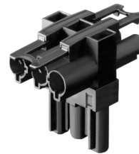
Distribución Distribution Distribution