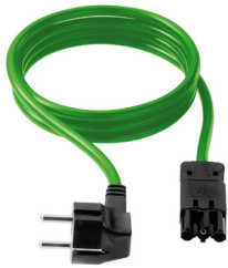
Cables 2 m Câbles 2 m Wires 2 m